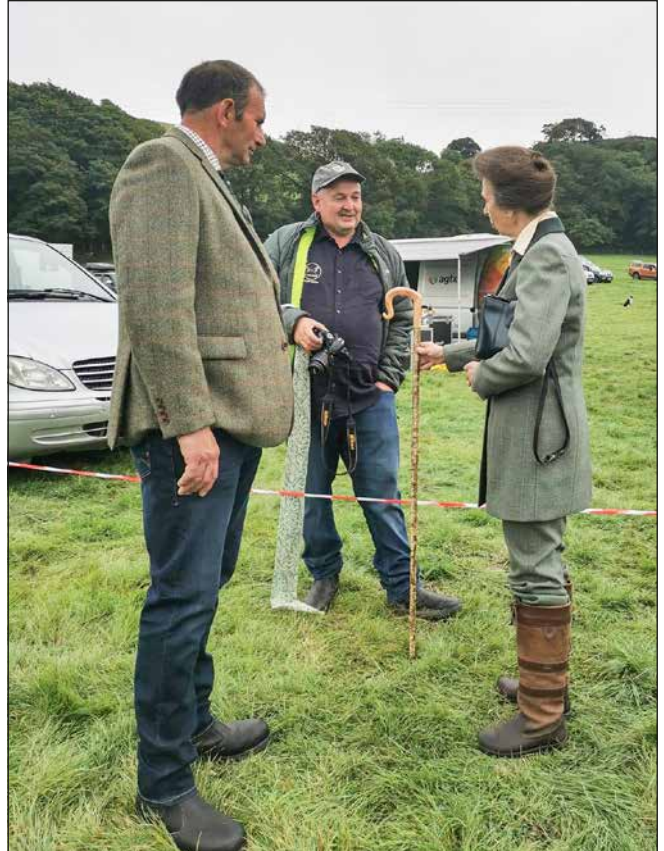
Prinsessa Anne ihastelee Internationals kilpailuihin tehtyä paimensauvaa. Anne on tunnettu maaseutu- ja käsityöammattien tukija Brittein saarilla.