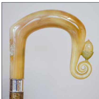
Prinssi Charlesin kävelykepin yksityiskohdat ovat todellista käsityötaitoa ja -taidetta.