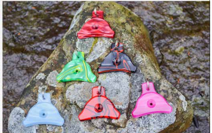
Dafyddin pillejä löytyy monenvärisinä. Osa on tehty pässinsarvesta ja osa mineraalikulidusta.