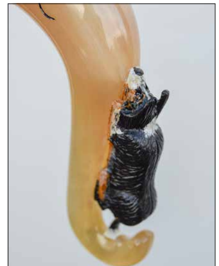
Paimenen koira on ikuistunut sauvaan.